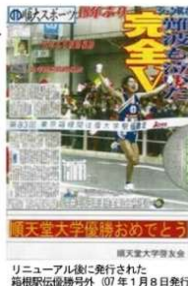
リニューアル後に発行された 箱根駅伝優勝号外 (07年1月8日発行)